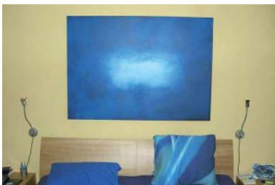
Ein Bild, in das man am liebsten eintauchen möchte: Farbe Mobil in Blau.