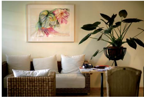
Der natürliche Wohnstil: Korbmöbel kombiniert mit mineralischen Lasurfarben in Grün.