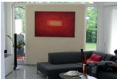
Das rote Farbe mobil Bild bringt die Kraft des Feuers ins Wohnzimmer.