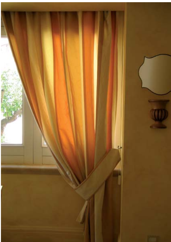
Die Wohlfühl-Oase wird abgerundet mit passenden Vorhängen und Lampen.

Gestalten Sie Ihr Zuhause im Wohlfühl-Wohnstil