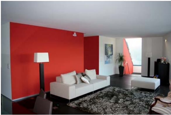
Rot ist die Farbe der Aufmerksamkeit und bringt frische Energie in den modernen Wohnstil.