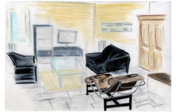
So könne sie sich in die neue Wohnwelt einfühlen – dank einer Skizze von „Die Welt in Farbe AG“.