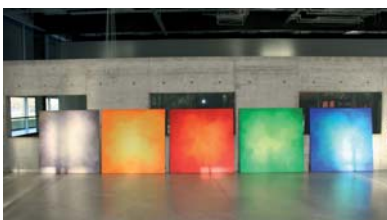
Attraktive Lasurgestaltungen auf Leinwand bringen Stimmung in moderne Betonbauten.

Farbe mobil heisst das neueste Produkt in Sachen Farbgestaltung. Die Welt in Farbe bietet tiefgründige Lasuren in Acryl auf Leinwand an. Diese neue Art der Farbgestaltung bringt Stimmung in Wohnräume und Geschäftshäuser. Mit ihnen lassen sich auch Treppenhäuser oder lange Gänge optimieren. Farbe mobil ein Blickfang für jeden Raum – und mit Farbe mobil lässt sich auch saisonal dekorieren.