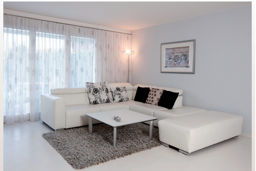
Moderner Wohnstil: Mit champagnerweissen und seidengrauen Farbtönen, die Wand in himmelblau, der Boden fugenlos.

Bei der Wahl der Farbe unterscheiden wir zwischen den üblich angewendeten künstlich hergestellten Pigmenten und den hochwertigen Naturpigmenten. Die meisten Wohnraumfarben erhalten ihren Farbeffekt durch künstlich hergestellte Pigmente. Diese Farbpigmente streuen das Licht, sie